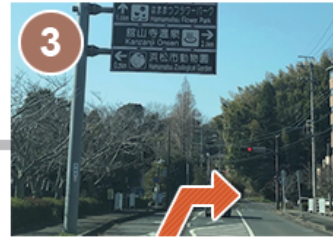
(3) 県道320号線を道なりに進み、交差点「動物園入口」を右折し、直進。