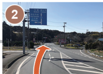
(2) 東名高速の下をくぐり、そのまま直進