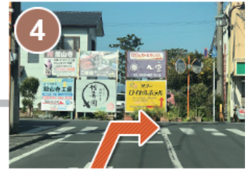
(4) 突き当りを右折して館山寺温泉外へお進みください。