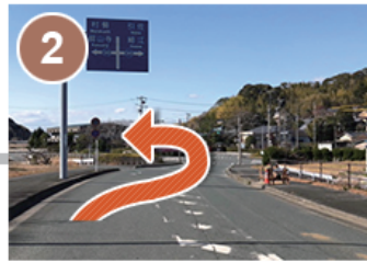
(2)「新呉松橋北」交差点を左折